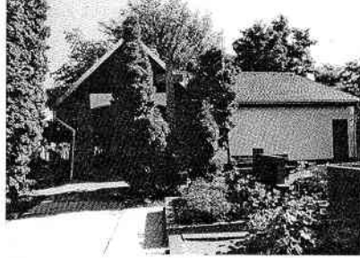
Jeden namiesto dvoch rovná sa estetická matematika...

vyrástol na mieste bývalých úžitkových priestorov. Investorom a správcom stavby je Bratislavské pohrebništvo Marianum v spolupráci s MČ BA-Lamač a Hlavným mestom SR Bratislavou. Realizácia projektu spoločnosti PRO-X Bratislava, na ktorý vydal stavebné povolenie Okresný úrad Bratislava IV 16. novembra 1998 stála cca 1,09 milióna Sk, a na tejto sume sa mestská časť Lamač investorsky podieľala čiastkou 591 000 Sk. Dostavbou a prestavbou priestorov dvoch