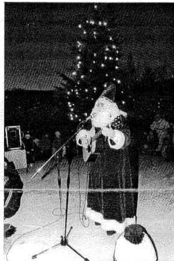
Mikulášku atmosféru doplnil aj rozsvietený vianočný stromček.

Hviezdička betlemská, kde si? Putujem cez hory, lesy. Ježiška hľadám. Poklady nenašli by ste, srdce len chudobné, čisté do jasieľ vkladám.