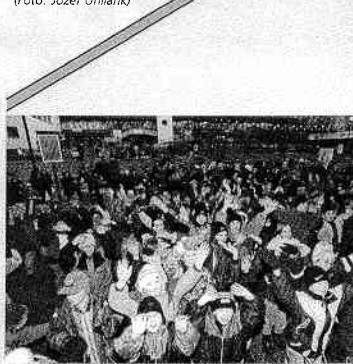
Najkrajším podákováním boli úsmevy detí

Aj v Lamači boli kedysi Vianoce udalosťou, ktorá sa túžobne očakávala. Tešili sa na ne dlho deti i dospelí. Bol to čas, v ktorom sa bolo potrebné zastaviť, vypustiť staré starosti všedných dní a v pokoji rozmýšľať o tom, čo rok dal i vzal, Premýšľať o tom, čo sa udialo i nesplnilo, ale aj snívať o dňoch, ktoré prídu. Bývala to príležitosť poďakovať sa za všetky dary Neba i Zeme, možnosť pokriak na tele i na duchu. Aspoň malou spomienkou skôr narodených Lamačanov Vám chceme priblížiť atmosféru Vianoc zašlých čias.