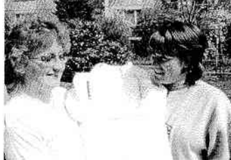
Novú knižku pokrtili ako bábabko v historickej peninke.