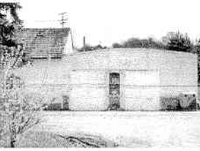
Sv. Florián, ochrányť ho, kto sa odváža vystúpiť.

Starolamačanom, ale i návštevníkom historickej časti našej obce v poslednom čase určite neraz padol zrak na chátrajúcu budovu nedávke konečnej autobusových liniek, ktorú si mnohí ešte pamätajú ako "starú poštu" či požiarnu zbrojnicu. Obiata omliečka, rozpadajúca sa murivo, deravá strecha či skládka odpadu na dvore však už dávno nesvedčia o ľudskej aktivite a nablyskaná požiarnická technika sa rozoznáva iba v spomienkach pri pohľade na patróna požiarikov sv. Floriána. Obe spojené budovy sú v správe mestskej časti Bratislava - Lamač a patria k potenciálnym dlhodobým zdrojom príjmov obce. Od minulého roka sa pokúša nájsť vhodného investora, ktorý by si objekt prenájal, avšak situácia je vážna, pretože obe budovy roky chátrali a podľa odborného posudku je ich celkové opotrebenie 85%, a teda vyžadujú rekonštrukciu vo výške niekoľko stotisíc korún. Najatraktívnejší projekt