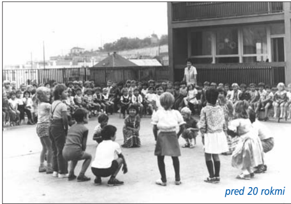
pred 20 rokmi