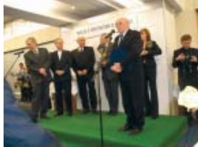
Prezídium Nadácie Slovak Gold udelilo Ústavu merania SAV Certifikát kvality a Zlatú medailu Slovak Gold za objav systému na meranie náklonu veľkých objektov.

Ako prebehla samotná ceremónia? Stretli ste sa aj s inými držiteľmi ocenenia? - Najprv sa konala výstava ocenených exponátov. Prišli na ňu aj novinári, fotografi a televízne štáby, ktoré všetko dokumentovali a robili rozhovory s jednotlivými ocenenými. Potom nasledovala tlačová beseda,